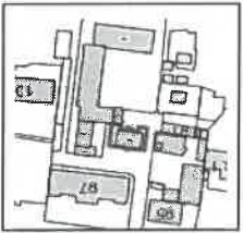
Масштаб = 1:5000

Координатын систем: WGS84/UTM 48N EPSG: 32648